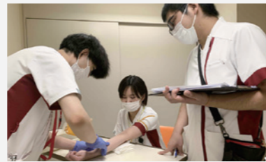
部署研修(看護技術研修)