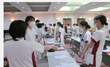
安全衛生(メンタルヘルス)