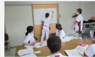
フィジカルアセスメント、急変時の対応