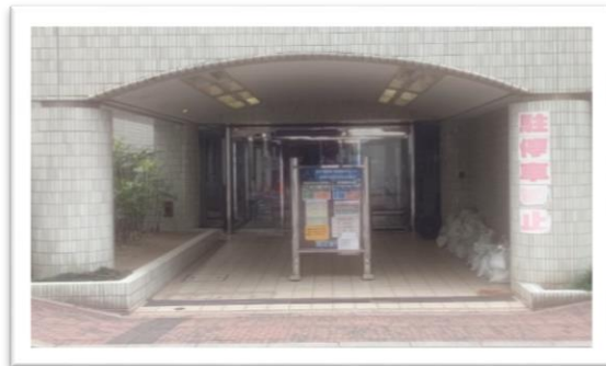
別館入口は東門向かい側にあります