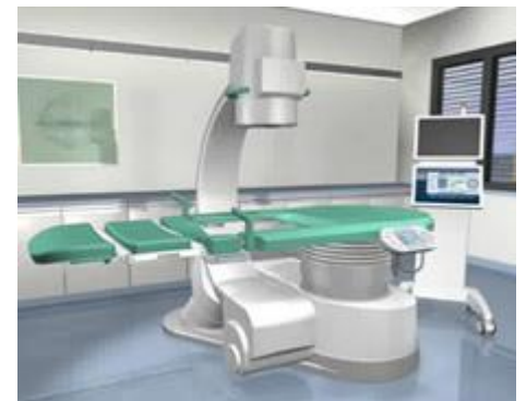
体外衝撃波結石破碎装置