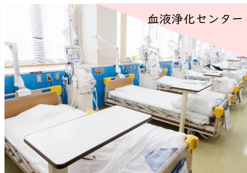
血液浄化センター