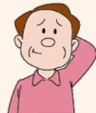
家族に腎臓病の人がいる