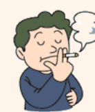
たばこを吸っている