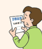
検診などでたんぱく尿が見つかったことがある