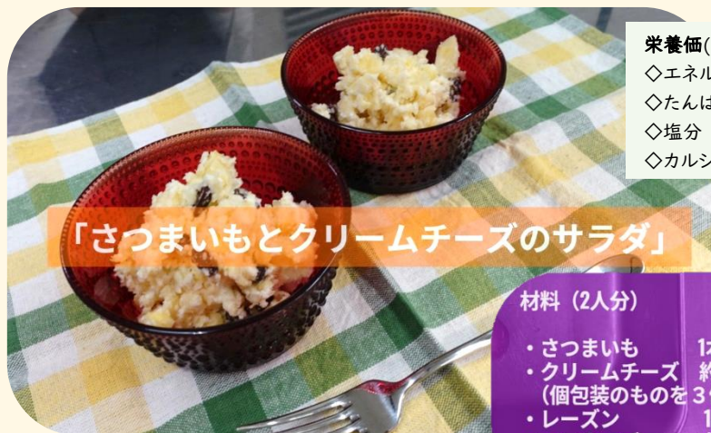
「さつまいもとクリームチーズのサラダ」

栄養価(1人分) ◇エネルギー 227 kcal ◇たんぱく質 3.2g ◇塩分 0.6g ◇カルシウム 159 mg