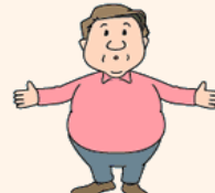
高血圧や糖尿病、肥満などの生活習慣病やメタボリックシンドロームがある