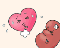
過去に心臓病や腎臓病になったことがある