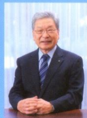
呉共済病院看護専門学校 学校長

わが国はこれから超高齢化社会を迎える中、 益々、看護の必要性が高まっていくと思います。 その期待に応えるためには、高度な教育と実践が 求められ、看護の対象である人間に対し深い理解と 共感が持てる豊かな人間性を育成することが必要 です。本校は、少人数であるからこそ個性を活か した教育ができると考えて います。学ぶことは苦しい 時もありますが、何事も 楽しんで取り組むことで 克服できると思っています。